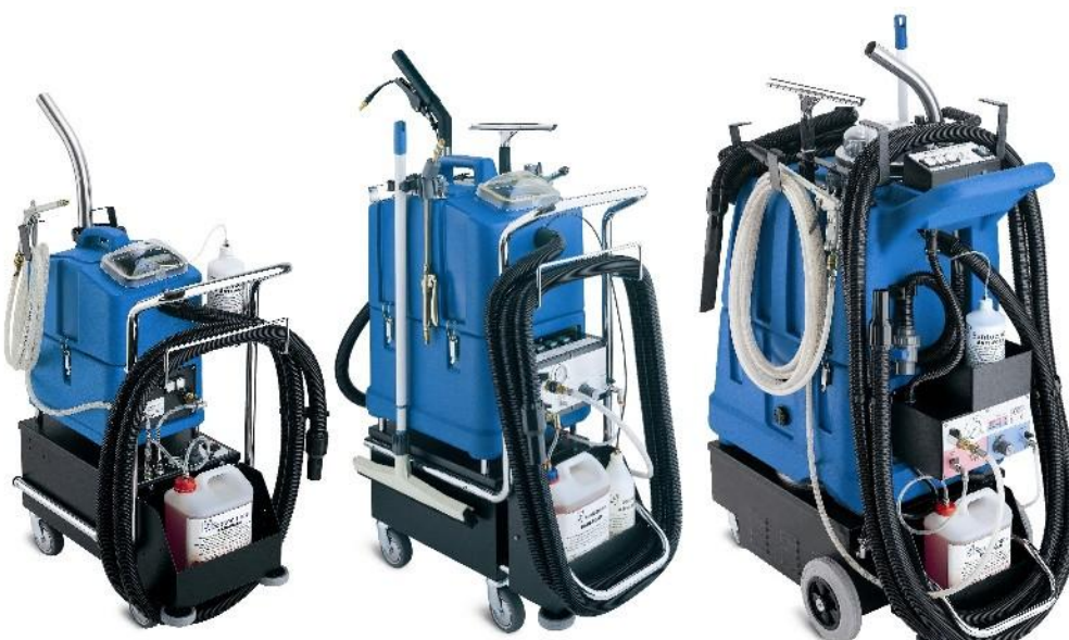
FRV FOOD 15