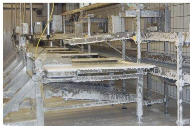
② Azione chimica